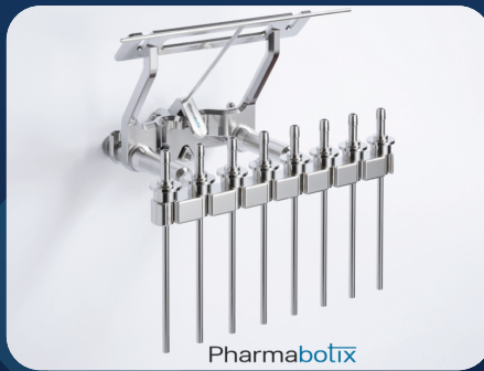
Engineering & Annex 1 lightspeed Projekte