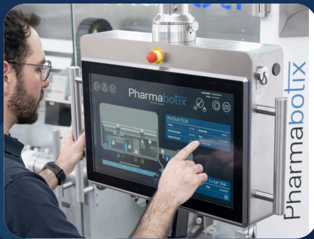
Modernste HMI & Steuerungstechnologie